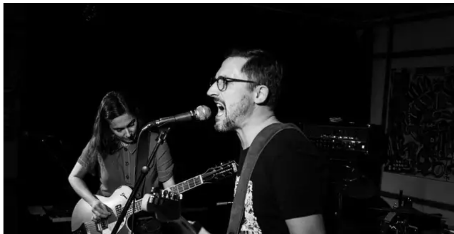
Isolate Junction est programmé par Trempo au square de la Boucardière