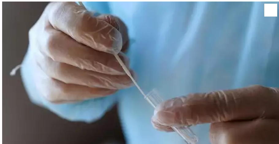
Un test antigénique réalisé en pharmacie. Photo d'illustration.

Cinq cas de variant Delta, ou « indien », du coronavirus ont été enregistrés en Loire-Atlantique en une semaine. L'Agence régionale de santé veut rester vigilante, alors que le département pourrait passer sous la barre d'un taux d'incidence de 50 cas pour 100 000 habitants prochainement.