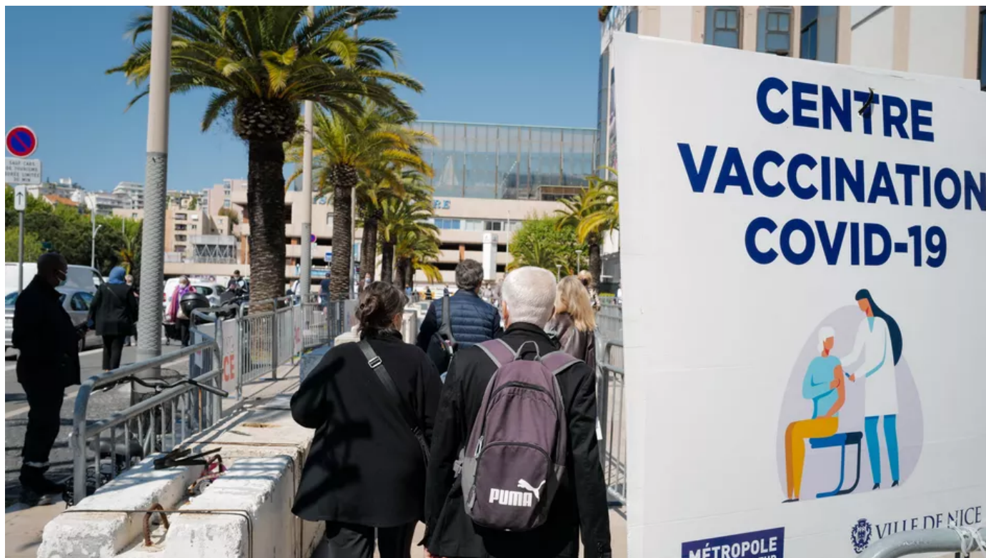
Une file d'attente devant un centre de vaccination situé au Palais des expositions à Nice (Alpes-Maritimes), le 23 avril 2021.

Un aménagement pour les vacanciers. Le ministre de la Santé Olivier Véran a annoncé mercredi 2 juin sur TF1 qu'il serait possible, pour tenir compte des vacances, de décaler son rendez-vous de seconde dose de vaccin contre le Covid-19 , "dans le même centre" de vaccination.