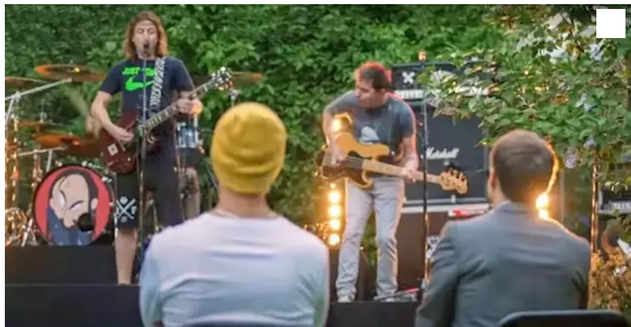
Le groupe nantais Ultra Vomit a joué à l'Élysée devant Emmanuel Macron.

Dans une explication sur sa page Facebook, le groupe de métal nantais, qui a reçu une avalanche de critiques après avoir joué devant Emmanuel Macron, assure qu'il ne l'a fait ni « pour la com', ni pour la thune » mais juste pour « blaster » le président.