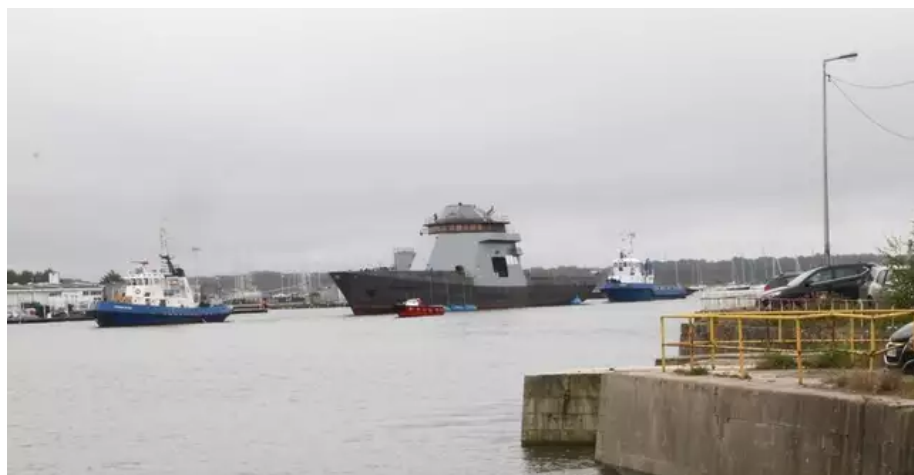
Le patrouilleur de 87 m construit par Kership Lorient, à Lanester, a été convoyé rive gauche du Scorff. Il rejoindra plus tard Concarneau où il achèvera son armement.

À 17 h 06, le convoi, salué par un public de passionnés, souvent des anciens du chantier du Rohu, a mis le cap sur Lorient. Le patrouilleur a été positionné au quai TCD, rive gauche du Scorff. Il rejoindra Concarneau plus tard où il terminera son armement.