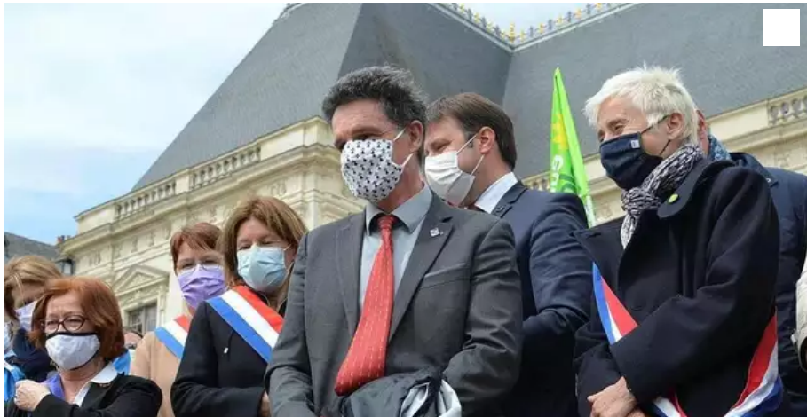
Paul Molac, député, au premier rang, lors de la manifestation organisée à Rennes, le 25 avril 2021, contre la saisine qui venait d'être déposée.

La décision des Sages de censurer deux articles de la loi Molac sur les langues régionales provoque de vives réactions en Bretagne. À commencer par le député Paul Molac qui dénonce un militantisme anti-langues régionales et une méthode réactionnaire.