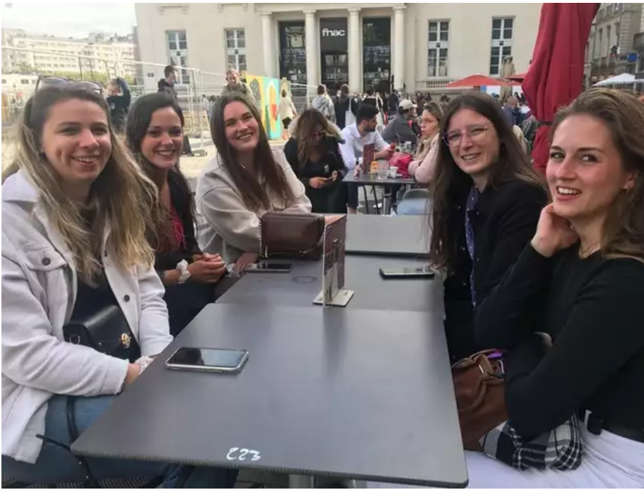
Des amies heureuses de retrouver les terrasses au café du Commerce.

Enigme. Quelle lettre complète cette suite logique ?