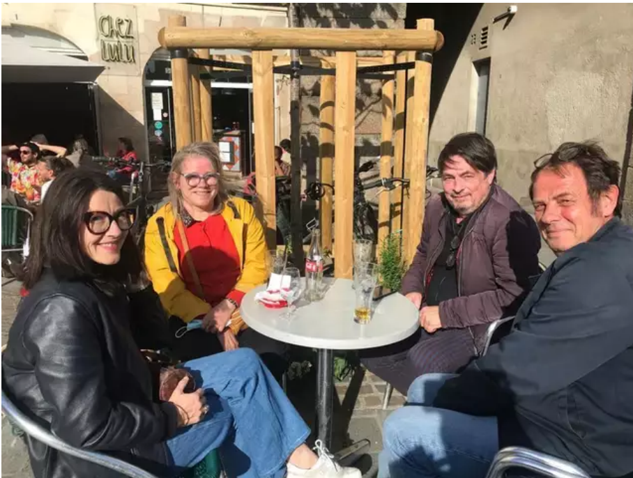
De très nombreux jeunes mais aussi des quinquas qui profitent d'une première gorgée de bière en terrasse, ici Chez Lulu place du Bouffay.