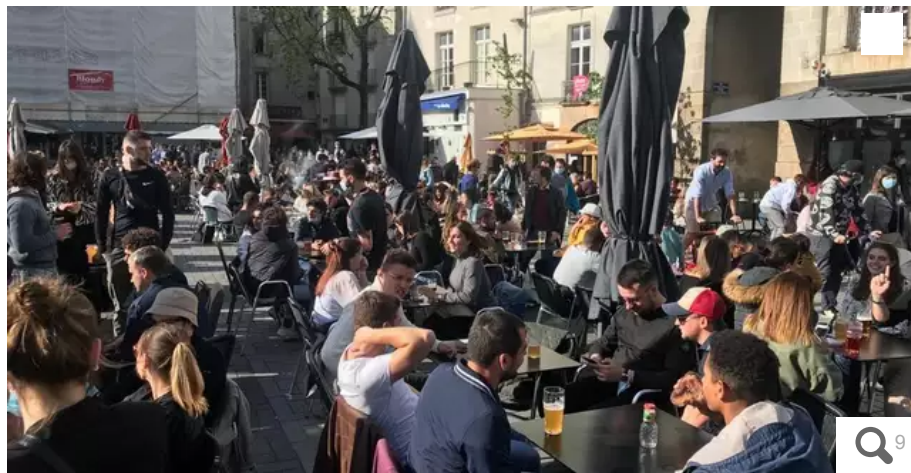
La foule place du Bouffay à Nantes digne « d'une finale de coupe du monde ou d'une fête de la musique »

Place du Bouffay, à Nantes, les terrasses sont bondées ce mercredi 19 mai en soirée pour la réouverture des terrasses des bars et restaurants.