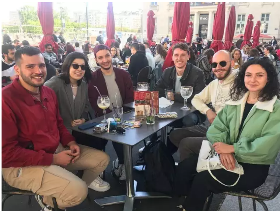
Au café du Commerce, à Nantes, des amis étudiants savourent la « libération »

Ils sont nombreux ce mercredi soir à savourer cette « libération » et leur premier apéro ou resto en terrasse, à Nantes . Retour en images sur cette première soirée de déconfinement pour les bars et restaurants.