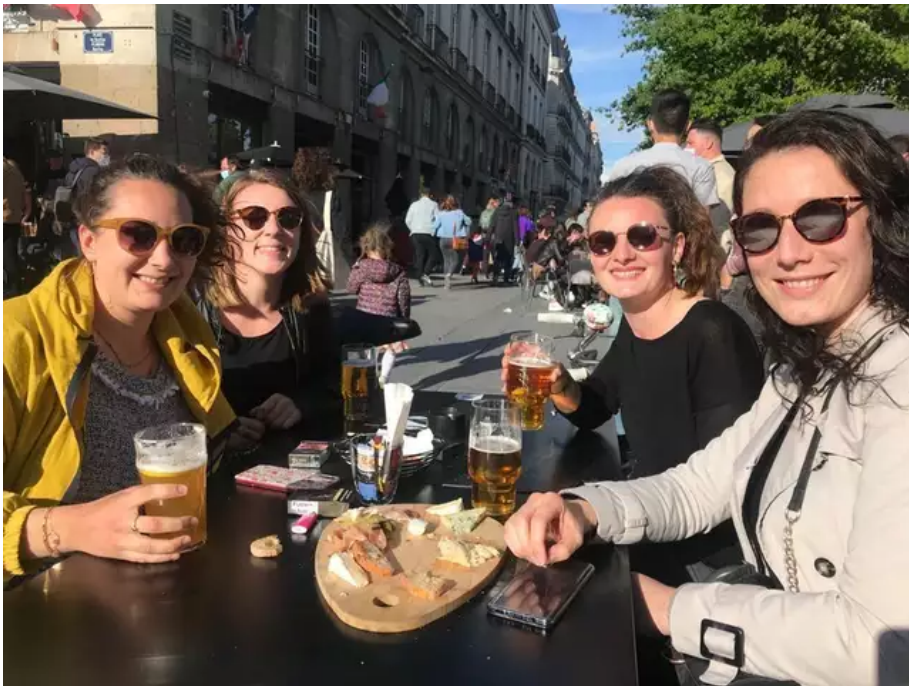
Ces jeunes enseignantes sont arrivées dès 15 h (« c'est mercredi ») en terrasse pour cette journée de libération.