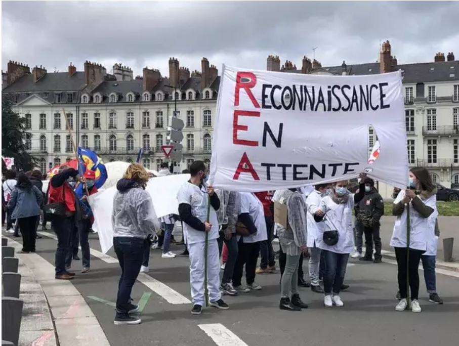
Des soignants de Nantes et de Saint-Nazaire mobilisés mardi pour avoir de meilleures conditions de travail.

9 Voir les dernières informations sur le COVID-19 sur Twitter