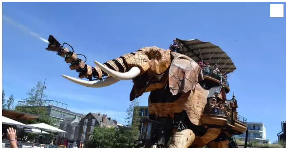
L'éléphant est la machine la plus prisée de l'île de Nantes.

Habitants de Vendée, de Loire-Atlantique, du Maine-et-Loire, de Mayenne et Sarthe, nous sommes tous des « Ligériennes » et des « Ligériens ». Le gentilé de ceux qui habitent les Pays de la Loire. Mais se sent-on Ligérien comme on se sent Breton ou Normand ou Occitan ? C'est la question qu'on avait envie de vous poser à l'occasion des prochaines élections régionales.