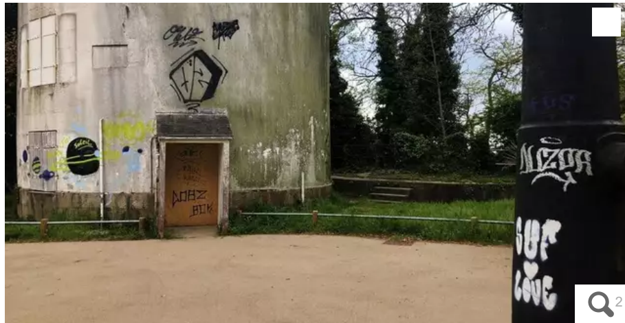
Le site historique des moulins du Péristyle vient d'être vandalisé.

Des tags à la bombe de peinture ont été réalisés sur les murs, les portes des deux moulins. Mais aussi sur un canon et les murets qui entourent le site historique des moulins du Péristyle à Lorient (Morbihan).