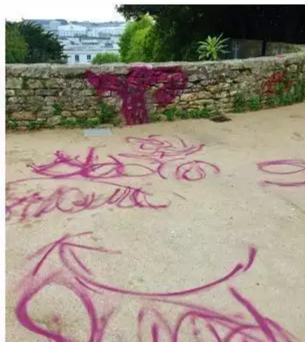
Le sol et les murets environnants les moulins ont aussi été dégradés.