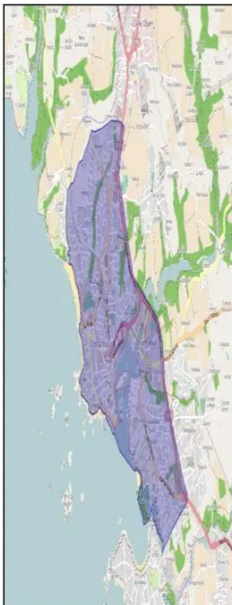
Zone où le port du masque est obligatoire.