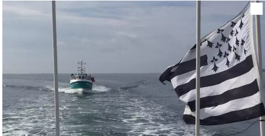
Le conseil municipal de Plœmeur (Morbihan) a formulé, mercredi soir 21 avril 2021, un vœu pour l'organisation d'un référendum en faveur d'une Bretagne à cinq départements.

En fin de conseil municipal, mercredi 21 avril 2021, à Plœmeur (Morbihan), l'assemblée a formulé un vœu pour l'organisation d'un référendum en faveur d'une Bretagne à cinq départements.