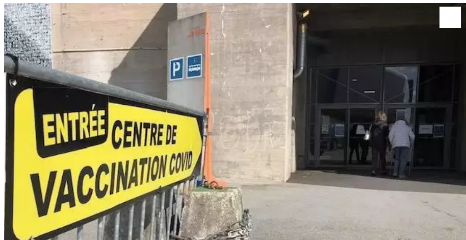
Le centre de vaccination Lorient-La Base a ouvert le 26 janvier dans la salle événementielle du K2, à côté d'Hydrophone.