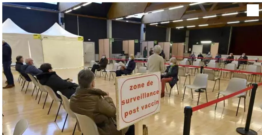
À Caudan, le jour de l'ouverture du centre de vaccination COVID-19, le 6 avril 2021, 2e grand centre de vaccination après celui de Lorient la base dans l'agglomération.