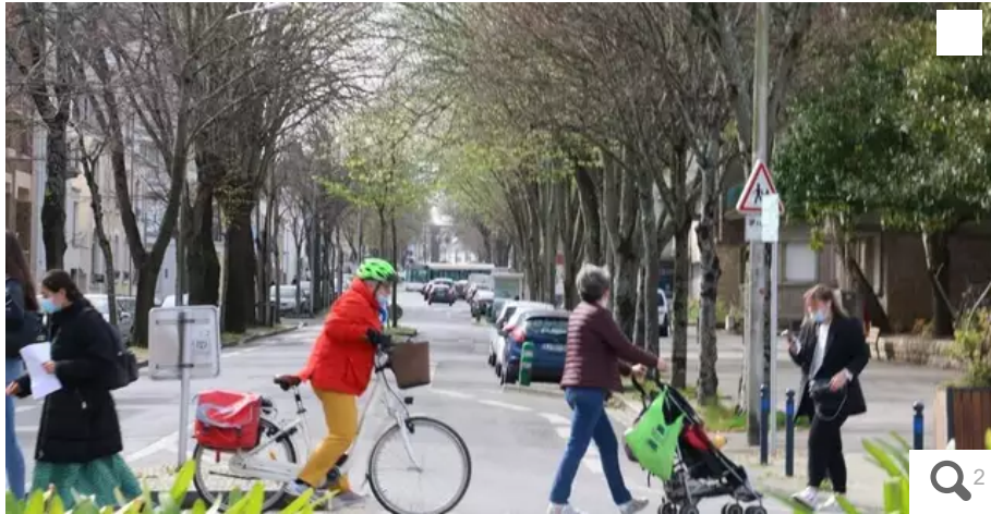
Tandis que la circulation des piétons et cyclistes va être sécurisée, les arbres de l'avenue de La Marne vont être progressivement remplacés par de nouvelles essences.

À la rentrée prochaine, l'avenue de La Marne à Lorient (Morbihan) et ses trottoirs feront l'objet d'une rénovation bienvenue. À terme, ses tilleuls devront être abattus, mais d'autres essences seront replantées.