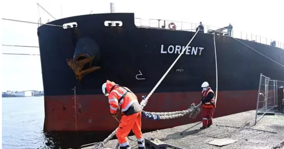
Le cargo « Lorient » à... Lorient. Une première ! Le navire livre 51 800 tonnes de soja.