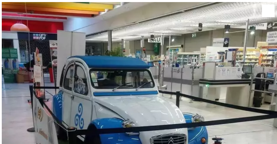
La 2CV mise par les Celtic Deuches

L'association bretonne « Celtic Deuches » organise une tombola pour gagner une 2CV de 1979 remise à neuf. Cette semaine, le bolide à gagner fait escale à Lanester.