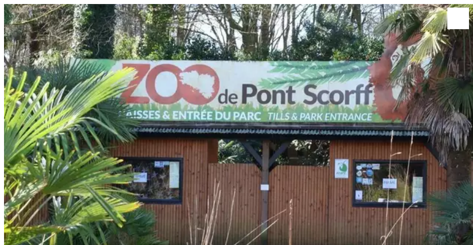
Entrée du zoo de Pont-Scorff.

À la suite du placement en redressement judiciaire du zoo de Pont-Scorff (Morbihan), « l'Association Française des Parcs Zoologiques (AFdPZ) et ses membres » indiquent, dans un communiqué, se « mobiliser auprès des autorités pour apporter leur soutien et trouver des solutions pour les animaux ».