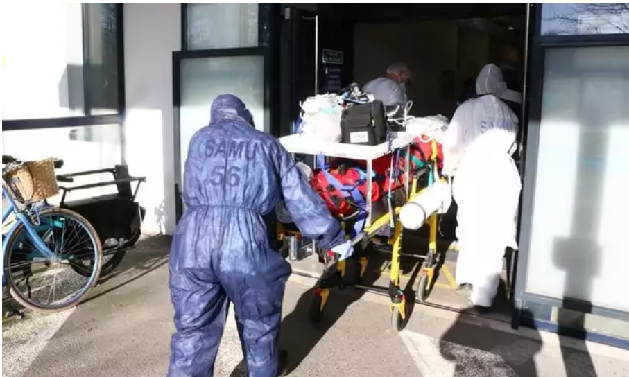
L'hôpital du Scorff à Lorient a accueilli ce vendredi 26 février 2021 deux patients Covid transférés par avion depuis Cannes et Saint-Laurent-du-Var.