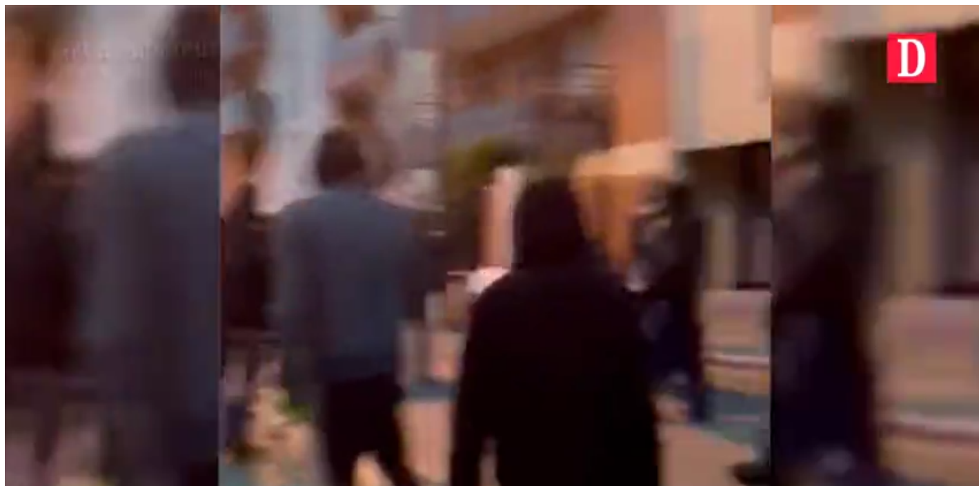
Haute-Garonne : à Toulouse les squatteurs quittent la maison de Roland

« J'y suis allé tout seul pour discuter. J'ai promis que, s'ils sortaient, il n'y aurait pas de violences. Ils ont fini par être à l'écoute. »