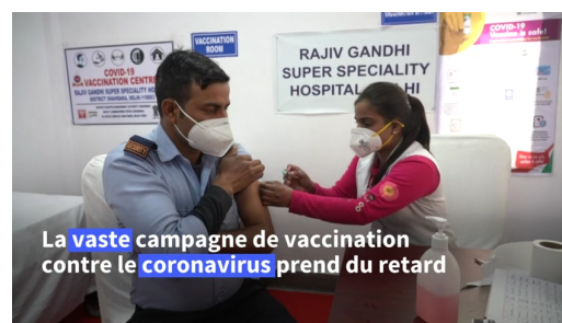
La vaste campagne de vaccination contre le coronavirus prend du retard