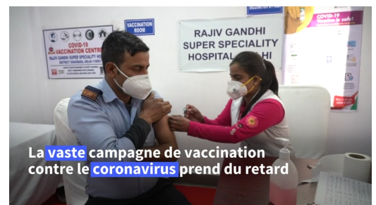
La vaste campagne de vaccination contre le coronavirus prend du retard