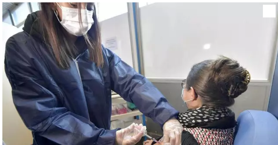
Le CHU de Nantes avait vacciné 7 113 personnes au 21 janvier.

Des retraités du CHU, de moins de 75 ans, ont bénéficié d'un vaccin anti-Covid. Alors que les centres de vaccination sont complets pour le mois à venir.