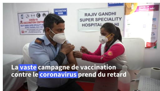
La vaste campagne de vaccination contre le coronavirus prend du retard