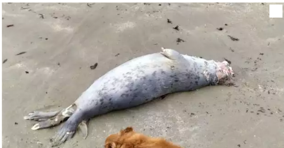
Le jeune phoque gris découvert par Julien samedi sur la plage de Fort-Bloqué.

L'animal a été découvert par un promeneur samedi 16 janvier 2021 devant le fort de Keragan à Pløemeur (Morbihan). Il pourrait s'agir du même phoque repéré mort mercredi dans une crique voisine.