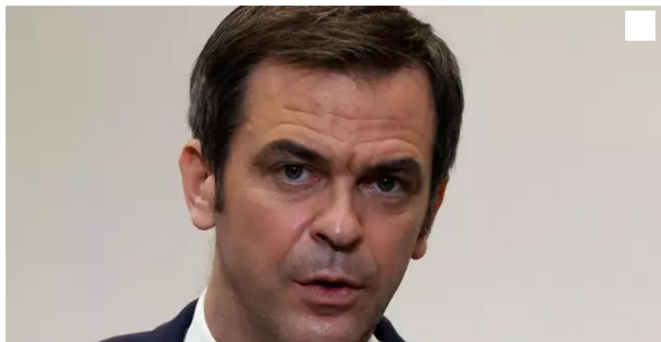
Olivier Véran, ministre de la Santé.

La région de Nantes pourrait-elle être un foyer de développement du variant sud-africain du coronavirus ? Ce jeudi 14 janvier, le ministre de la Santé, Olivier Véran, a évoqué un « cluster » avec un cas détecté à Nantes : une mère de famille originaire du Mozambique.