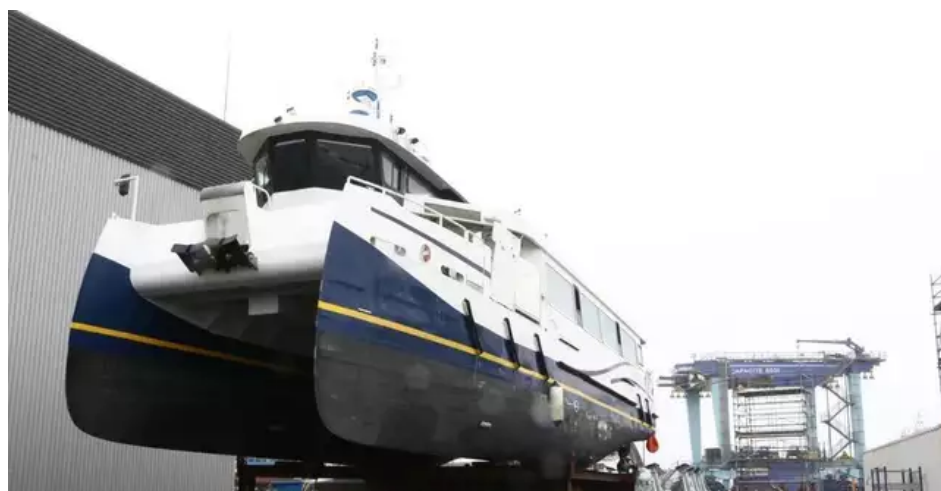
L'Ar Vag Tredan vit une nouvelle vie... au sec à Keroman.

Le bateau électrique est hors circuit depuis un an à Lorient (Morbihan). Sera-t-il motorisé ou carrément remplacé ?