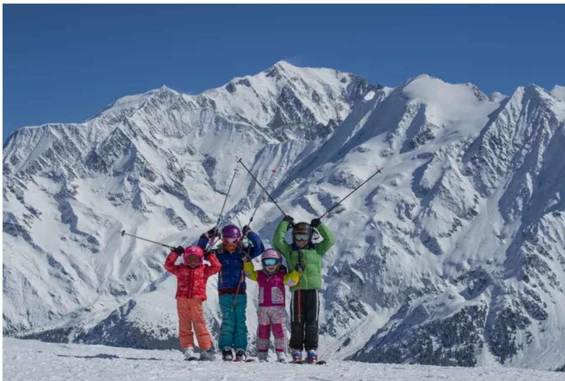
Le Mont-Blanc plante le décor sur les pistes des Contamines Montjoie.