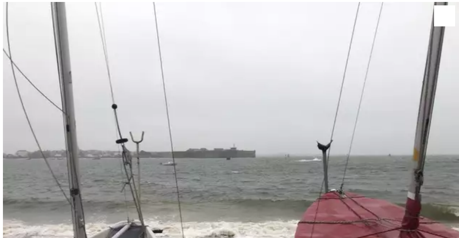
Nuages, vent, pluie au programme de ce week-end.

La météo de Pascal Talmon. L'anticyclone, au sud des Açores, va laisser les dépressions actives aborder l'Irlande avec nuages, pluie, vent et douceur sur la Bretagne.