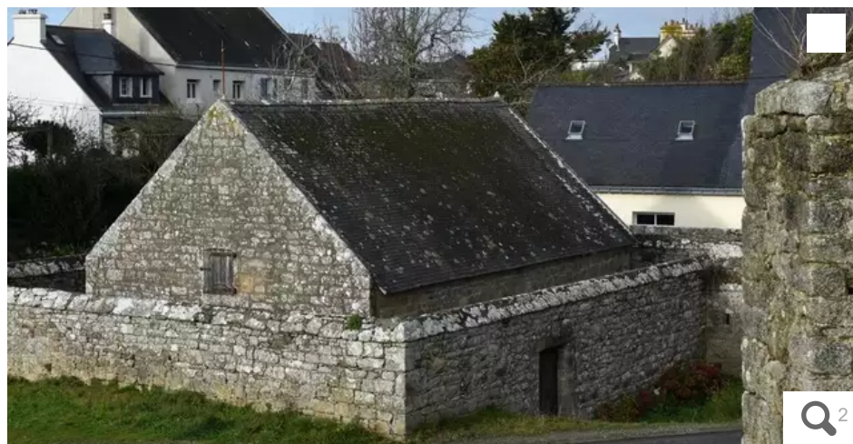
La petite Poudrière.