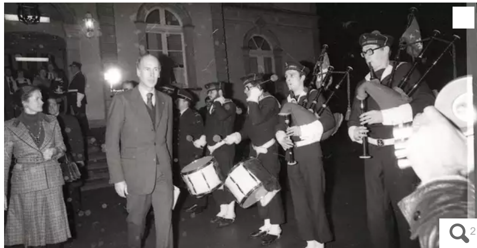
Valéry Giscard d'Estaing à Ploërmel, dans le Morbihan. Le bagad de Lann-Bihoué joue pour l'occasion.

Le 8 février 1977, à Ploërmel, Valéry Giscard d'Estaing annonçait la création d'une charte culturelle bretonne. Une reconnaissance inattendue de la diversité des territoires et des langues, sur un sujet qui reste toujours clivant aujourd'hui.