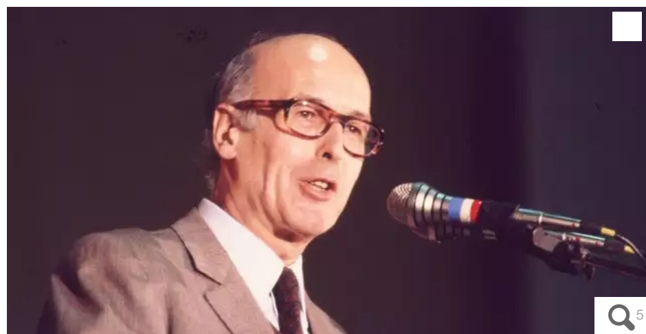
Valéry Giscard d'Estaing, président de la République, en campagne pour l'élection présidentielle à Nantes, en avril 1981.

Valéry Giscard d'Estaing est mort ce mercredi 2 décembre, à l'âge de 94 ans. Il est venu plusieurs fois en Loire-Atlantique, à l'occasion de meetings électoraux mais aussi pour défendre l'Europe.