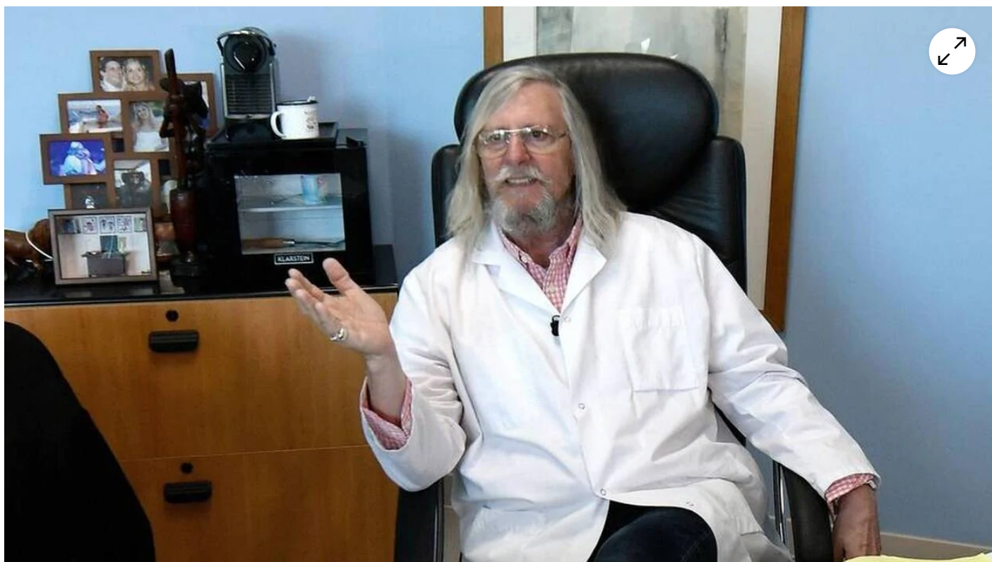
Les études concernaient l'hydroxychloroquine contre le Covid-19. (Illustration) | AFP

Les deux signalements concernant les études cliniques sur l'hydroxychloroquine contre le Covid-19 menées par l'IHU Méditerranée Infection de Marseille (Bouches-du-Rhône) et Didier Raoult ont été classés sans suite par le procureur de la République de la ville. Un professionnel de santé avait fait ces signalements en avril dernier. Ils concernaient les conditions dans lesquelles les études étaient réalisées.