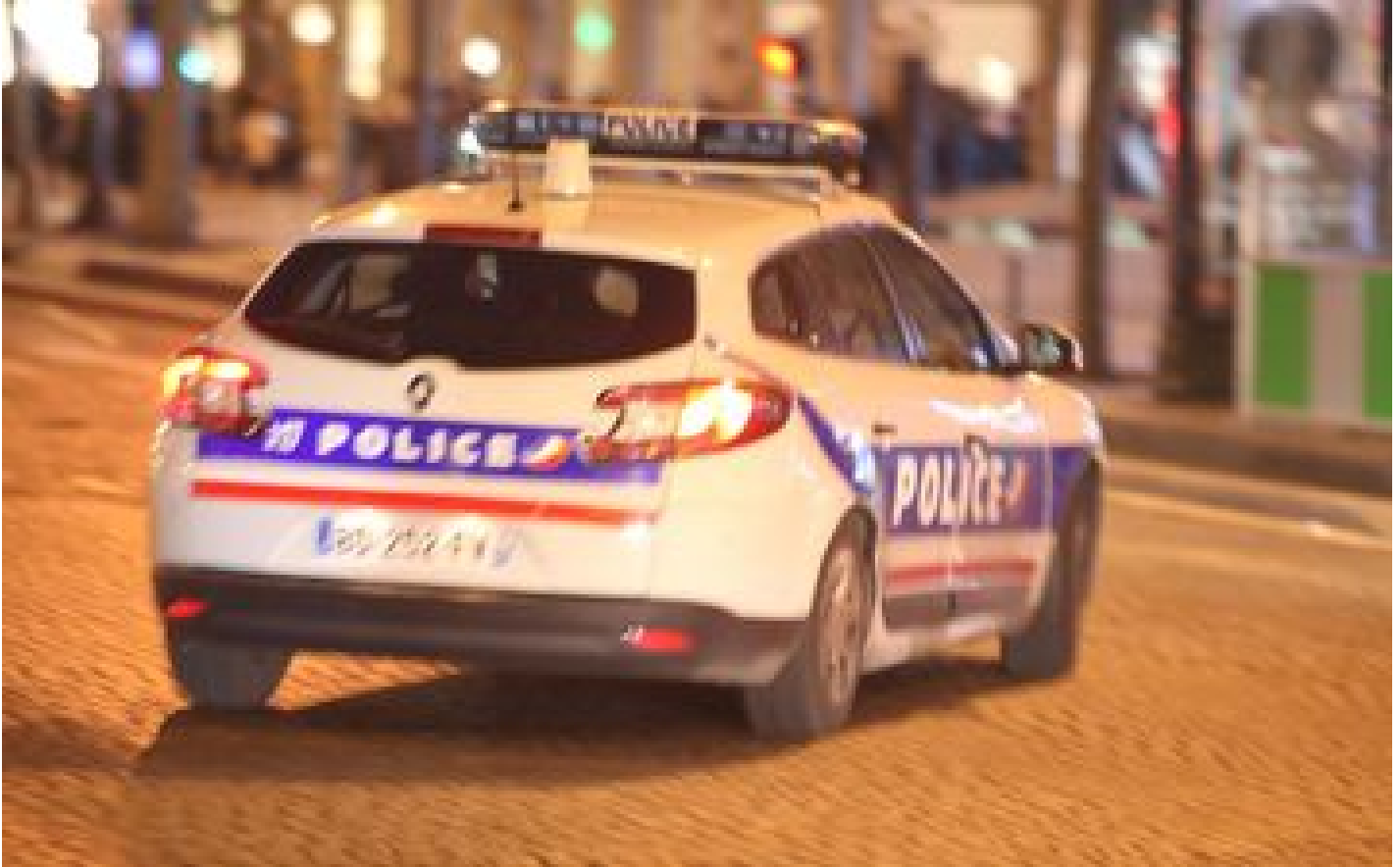
Toulouse : un homme tente d'étrangler un policier avec le câble de sa radio