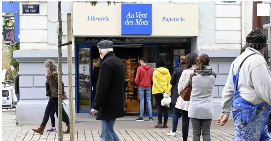
Un samedi en centre-ville de Lorient : étonnant, on patiente aux portes d'un commerce « non-essentiel », la librairie papeterie Au Vent des Mots.

N°3 Voile. Le Vendée Globe se dessine dans le Morbihan